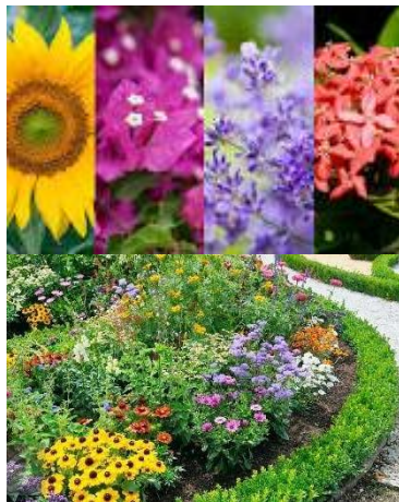
Gambar 6. Jenis tumbuhan bunga (Google, 2025)