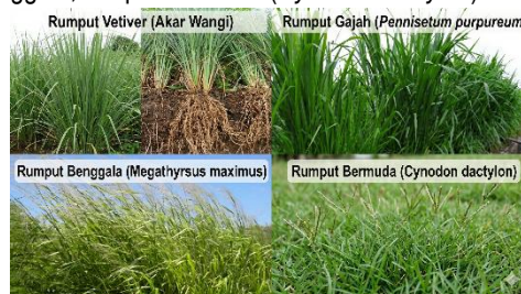
Gambar 8. Jenis tanaman rumput yang dapat mendukung stabilitas tanah dan visual