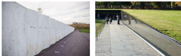
Gambar 3. Ilustrasi untuk dinding memorial (Google, 2025)