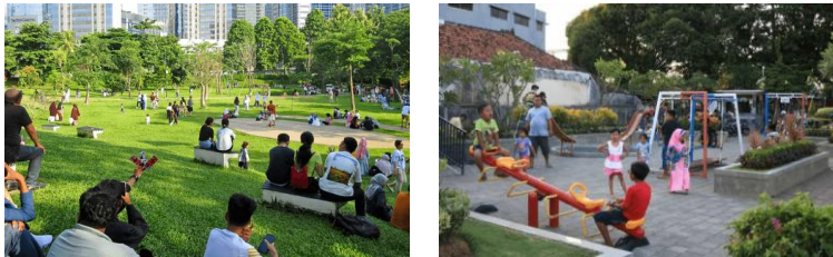
Gambar 2. Ilustrasi untuk rekomendasi elemen pembentuk plaza (Google, 2025)