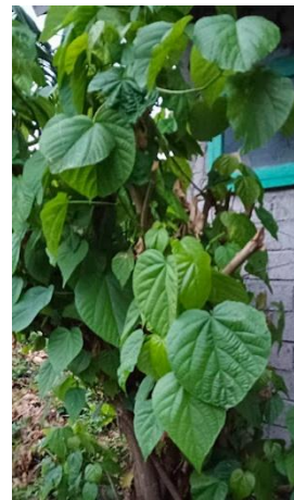
Gambar 7. Tanaman herbal Balaroo ( Kleinhovia hospita Linn) (Google, 2025)