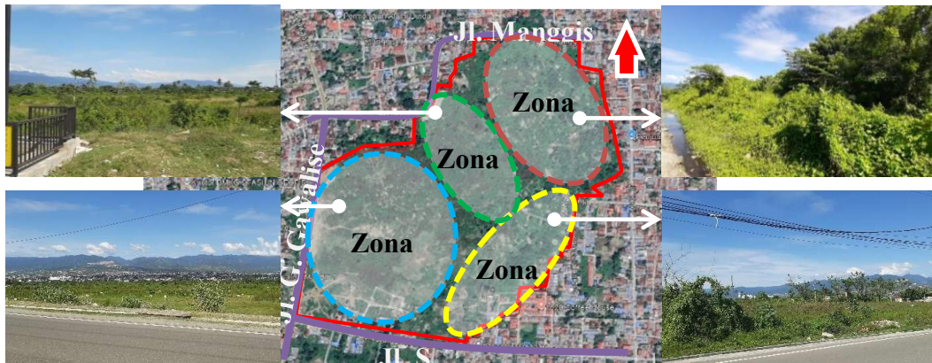
Gambar 1. Pembagian zona lokasi eks-likuefaksi Balaroa ( Goggle Earth Pro dan dokumentasi penulis, 2025)

Zona 1: memiliki luas \pm 37,4\% dengan kontur landai dan permukaan kering. saat ini kondisinya sebagian ditumbuhi rerumputan liar.