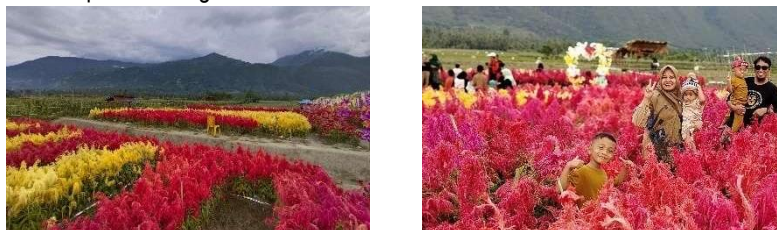
Gambar 11. Plot kebun bunga, (Taman bunga mekar asri)