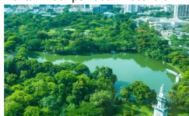
Gambar 16. Ilustrasi untuk plot cadangan air (Google, 2025)