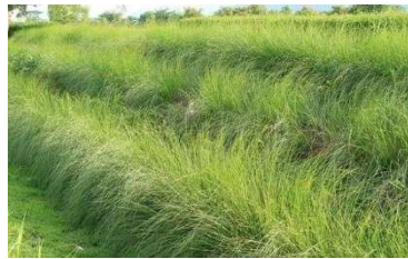
Gambar 12. Salah satu jenis rumput (vetiver) yang dapat memperkuat tanah dari longsor