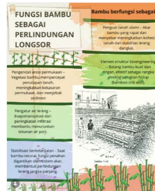
Gambar 13. Fungsi bambu yang dapat memperkuat tanah dari longsor