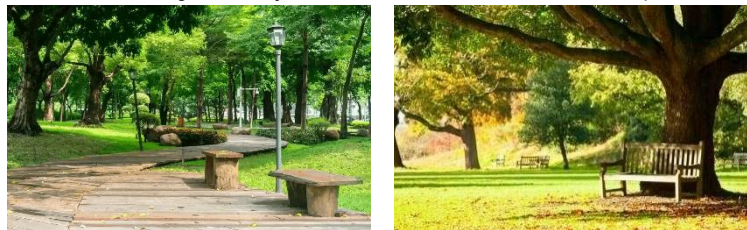
Gambar 4. Ilustrasi ruang refleksi (Google, 2025)