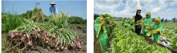
Gambar 10. Ilustrasi untuk rekomendasi Zona 2, (Google, 2025)