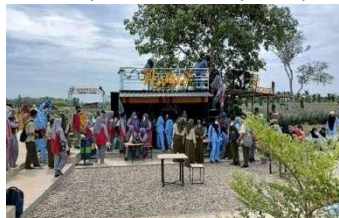
Gambar 14. Ilustrasi stand penjualan hasil pertanian agrowisata (Google, 2025)