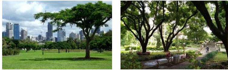
Gambar 5. Tumbuhan pepohonan yang ditanam dengan jarak tertentu (Google, 2025)