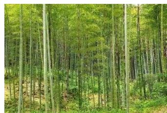
Gambar 15. Ilustrasi untuk plot tanaman pohon air (Google, 2025)