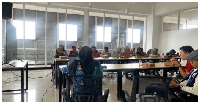
Gambar 2. Kelas UMKM oleh Dinas Koperasi Perindustrian dan Perdagangan Kota Malang