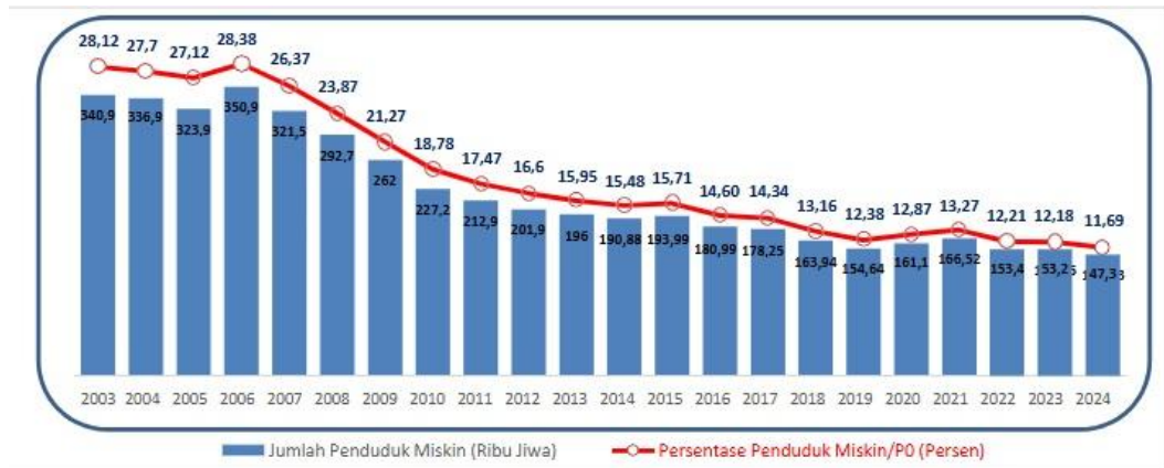
Gambar 2. Jumlah dan Persentase Penduduk Miskin di Kabupaten Bojonegoro Tahun 2003-2024